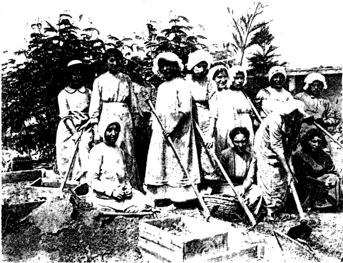
נשים חלוצות בעבודה חקלאית בעמק הירדן

העם. "יתרה מכך, היא רואה את הקושי הנובע מצמצום התרומה של אותן נשים למעמד הפועלים בלבד תוך הזנחת התרומה הנדרשת לחברה כולה. היא ממקמת למעשה את הירחון בין שני צדדות אלה: