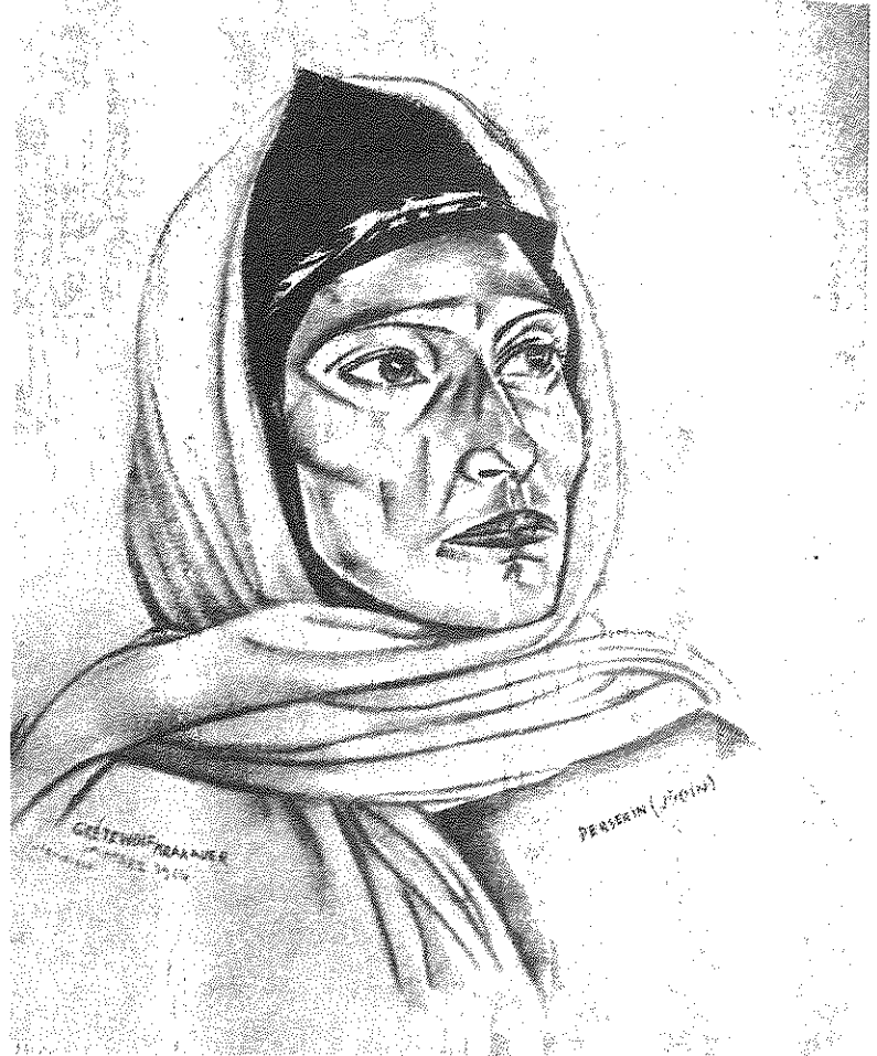
"יהודיה פרסיה" - איור מ"האשה", מעשה ידיה של גרטה וולף קראקואר

בשלוש שנותיו הציב "האשה" מודל של אשה מקצועית, משכילה ומרחיקת ראות מבחינה אינטלקטואלית הניתן והראוי להתחלל על כל שכבות האוכלוסייה.